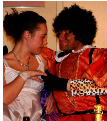
Die Oper und das wahre Leben geraten völlig durcheinander.

Missverständnissen und Verwechslungen sorgt, aus dem es kein Entrinnen mehr gibt. Das Publikum dankte es mit großer Heiterkeit und Szenenapplaus!