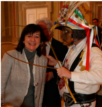
Beim Empfang im Landhaus kamen sich die Matschgerer und LR Palfrader näher.

Der längste Fasching seit langer Zeit stand vor der Tür und sollte erst am 6. März sein Ende finden. Der große Fasnachtsumzug fand dieses Jahr im Februar in Mils statt. Bei einem großen Empfang im Landhaus wurde erst einmal Werbung für die Sache gemacht!